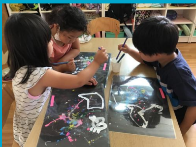
個性的な星座がたくさんできました♥「馬に人が乗ってる座」とか「トンネル座」などなど♫