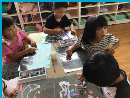
ラミネート板を星空にのせてクレヨンで下書き。ラミネート板なのでこすると消すことができます。