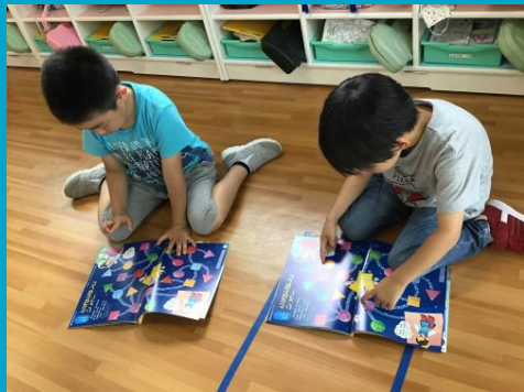
7月の月刊絵本にも星を見つけたよー♥