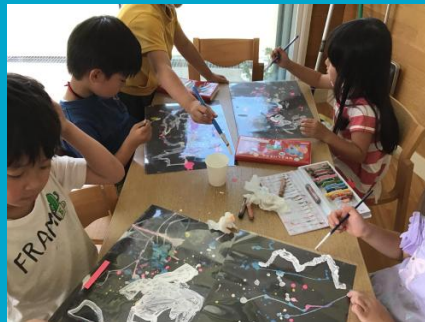
次はジーっと自分の星空を見て、どんな星座が隠れているのか探してみます。