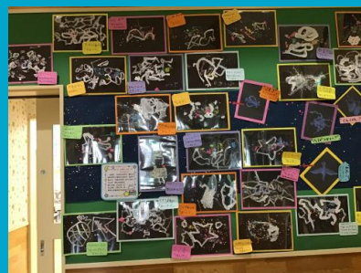
こあら組前のグリーンボードにきりん組の天の川が完成です！

いつもは明るいお日様の下で遊ぶ子ども達。天の川ってどうなってるの？七夕のお話から夜の空へと想像が膨らみます。夜空にはいろいろな星座があることを知り、また子ども達の世界が広がりました。どんな星座を作りたいかユニークな考えがたくさん！スタッピングで表現した星は自分の力加減一つで色々な輝きが☆いざ星をつないでいくと星座がたくさん見えてきました。この夏は夜空をゆっくりと眺めるのもいいかもしれません