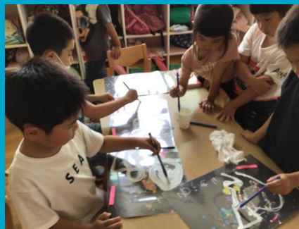
決まったらアクリル絵の具で描いていきます。点つなぎの要領です。