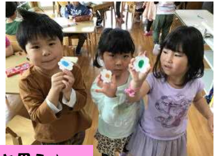
きっと、こんな色で形はこんな感じだと思う♪