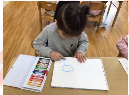
そのあとは自分のお絵描き帳にお絵描き!! ✨「今、先生書いてるの♪」と似顔絵を書いてくれています♥