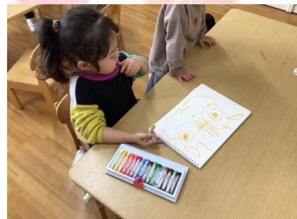
👧「これはりす書いたんだよ ✨」 🧒「えー、とっても上手 🙌」と褒められちょっぴり恥ずかしい様子です 😊