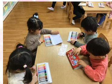
まずはみんなで何色があるかクレヨンをチェックしたよ 😊 赤や青などいつも見慣れている色はわかったけど、こげちゃ色など見慣れない色に興味津々♪