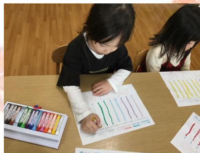
真っ直ぐだけど線をなぞることが難しい 🌧️ と苦戦する子もいましたが、みんな集中してなぞっていました ✨