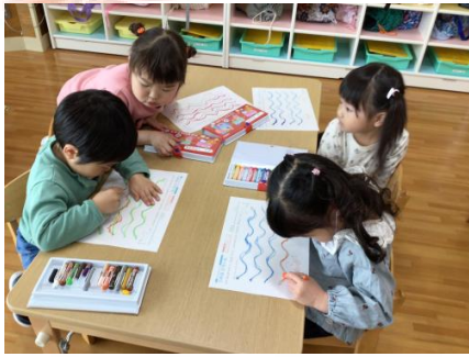
「どう??上手にできたー??」とお友達の様子を伺っていましたよ 😊