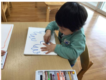
あらあら??何だか面白いことをしているお友達発見!! 😊 発想が素晴らしい ✨自分でやってみたいことを見つけている姿が増えてきたうさぎ組さんです 🐰