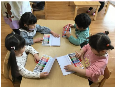
今日からクレヨン始めました ✨ 名前づけありがとうございました 😊