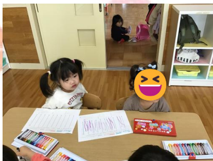
カエル 🐸 やカタツムリ 🐌 に雨を降らせてあげようと雨に見立て真っ直ぐな線を引けるかやってみました 😊