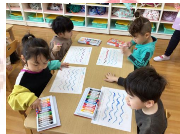
次は海の波に見立て、～線を書いてみました 😊 これが子どもたちにとってなかなか難しかったようで、～の線関係なく書いていた子が多かったです 😊