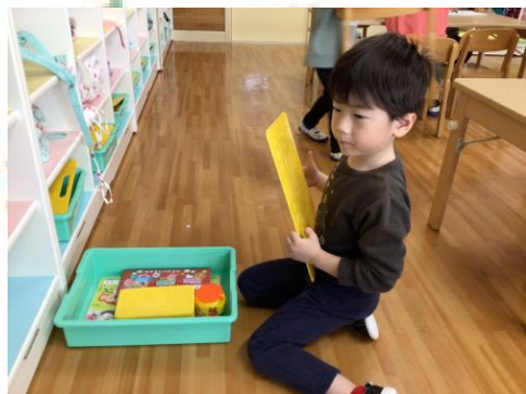
お絵描きをした後のお片付けもバッチリです👍

自分だけのクレヨンを喜んでいたりした子どもたち😊 まずはどんな色があるか、持ち方はどうか確認しました💎 まだ上手く持てない子もいますが、少しずつ正しい持ち方でお絵描きが楽しめるようになっていきたいと思います♪ 去年に比べると筆圧も強くなり、絵の書き方もダイナミックに😄 動物や友達の顔、パパとママの顔など細かい部分も上手に書けるようになっていて、私たちもびっくり!! 😊 成長を感じたお絵描きタイムでした😊