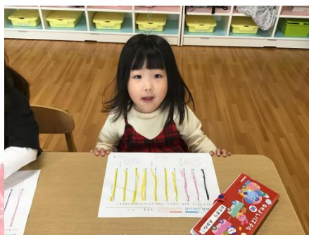
「カラフルな雨にしたよ 😊」