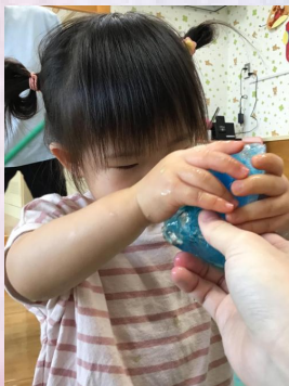
大きい氷、つかんでみたよ。