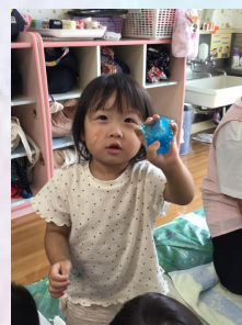
「きれい💎💎」 破片を見つけて何度も透かして見ていました。