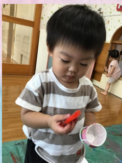
触って、観て、じっくり観察。