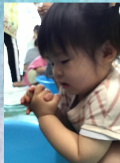
氷をつかんだらね、お手々がキンキン冷たくなったの。