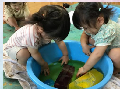
カラン♪カラン♪と氷がぶつかる音も楽しんでます。