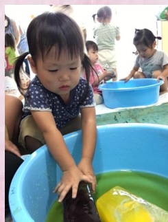
わたしも触ってみるね。勇気を出して両手でぎゅっ！