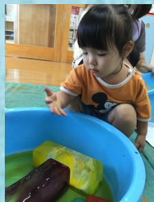
触った後のお手々をじっくり見ながら、冷たい！ツルツル！黄色？と、様々な情報を確認中。