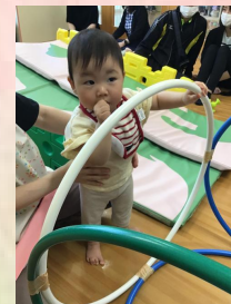
運動機能も高まってきて、ハイハイやつかまり立ち等、それぞれ盛んになり、意欲的に体を動かせるようになりました💡