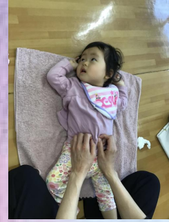
お次はミッキーマウスマーチの歌に合わせて、触れ合い体操🔥