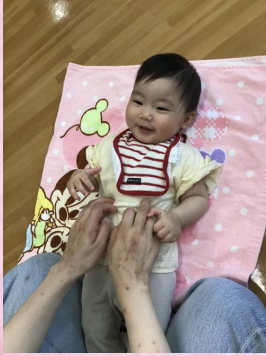
♪階段登ってちょちょよ〜!!!♪