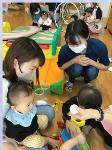
チェーンやボール落としも楽しみました😊お友達同士の関わりもみられて良かったですね💡