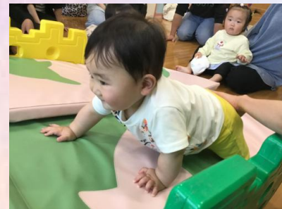
さて、遊びの時間は、普段皆が慣れ親しんでいる滑り台やトンネル💡