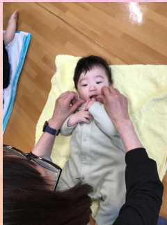
口や手、頭など体の色々な所をヨシヨシしてもらって、心地良さそうな子ども達😊