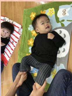
お家でもぜひ楽しんでみて下さいね◎♥