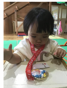
貰ったメダルに子ども達も興味津々👁️🌟一生懸命触って中を開けようとする子も 😊