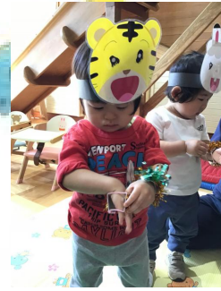
次はお遊戯ハッピージャムジャム❤️しまじろうやみみりんのお面をつけて踊ります 🐯 🐰