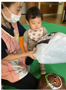
ハンバーグや卵焼きなど色んなおかずがある中から、しっかり選んで持って行ってましたよ👍