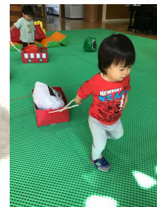
自分でおかずをバスに乗せて引っ張っていく子ども😎