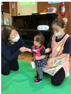
「園長先生ありがとう❤️」