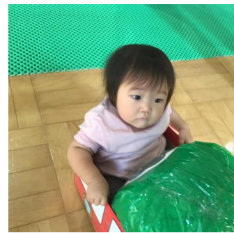
しっかり捕まってバスに乗ります😁