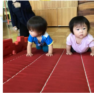
「頑張って登りきるぞ〜😓」