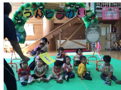
運動会の大きい看板をバックに記念撮影もしましたよ📷