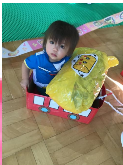
卵焼きと一緒にゴールしたよ👏