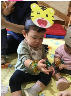
「腕にキラキラもつけてもらったよ🌟」みんな上手に腕を振ったり、体を揺らしながら踊っていました 😊