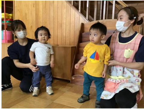
ドキドキワクワク❤️今か今かと合図を待ちます😎