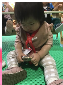
「メダル嬉しいなあ🎵中はどうなっているんだろう？」