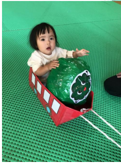
先生に引っ張ってもらってゴールまで一直線！ぐんぐん進むぞ 🚗 🍃