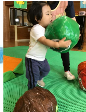
ブロッコリー🥦をゲット😁バスまで急げ〜!