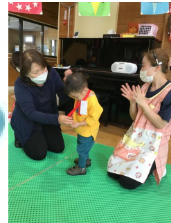
最後は園長先生からメダル🏆を貰った子ども達 😊