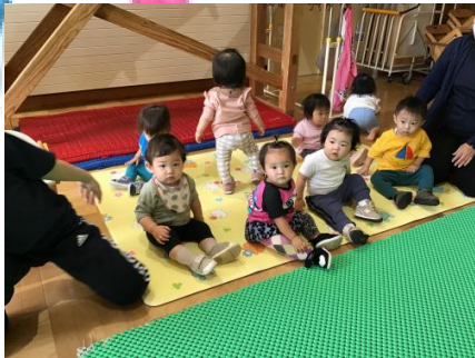
お行儀よく座りながら、自分の順番待ちをしているひよこの子ども達👏