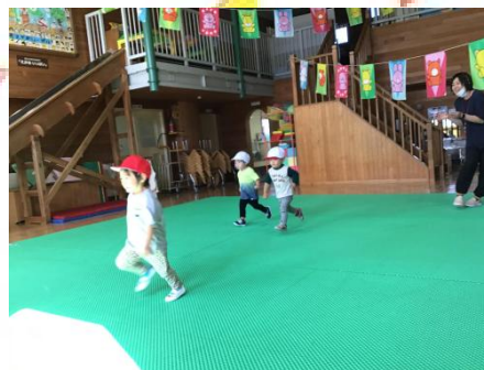
よーいどん！の合図で、ゴールに向かうことができるようになり、同時にやる気も感じられます(^_-)☆