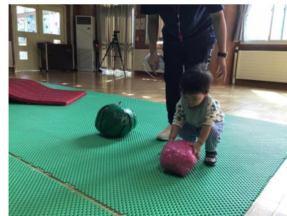
「せんせい、ぼくはこっちにする！」自分の好きなフルールがあるようです😁