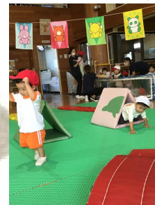
かけっこも、障害走も、本当によく頑張りましたね♪