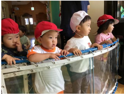
待っている子ども達も、みんなを応援してあげていましたよ！！