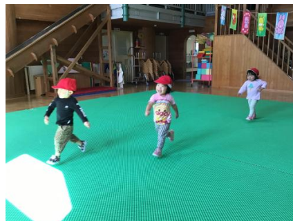
「がんばれ！」「がんばれ！」の応援に答えるように、一生懸命走っていましたよ！(^_^)/