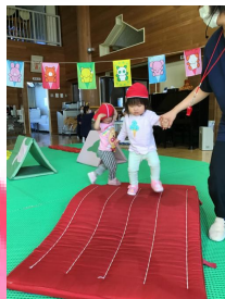
盛りだくさんの障害走かな？と思いましたが、内容を理解して、一つ一つ取り組む子ども達に、成長を感じる競技になりました😁