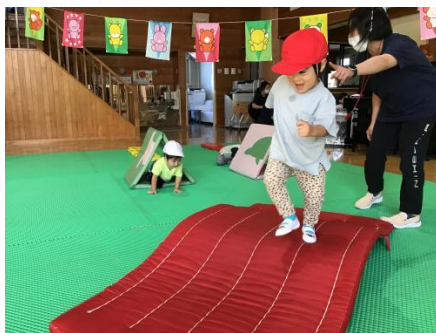
坂道だって怖くない！！