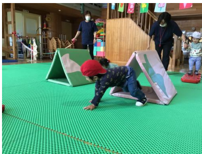
マルチパネの1本橋、トンネル、マットの坂、いろんな障害がありましたよー！