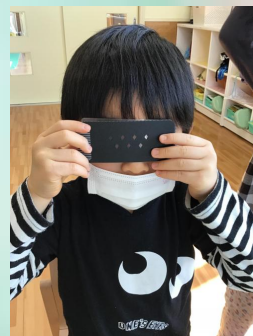
この黒いシートと、