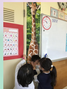
等身大のきりんポスターも🎀毎日背比べをしている子どもたちです😌