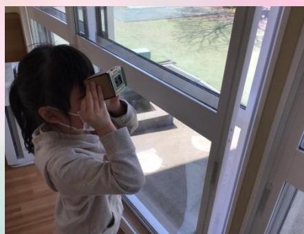
色々な場所を覗いたら、色々な景色が見えるね😌