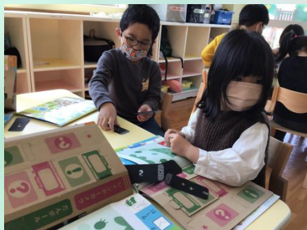
レインボーカメラを作ったよ📷