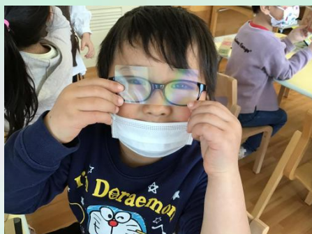
透明のシートを組み合わせると…✨