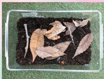
土も入れて、ダンゴムシハウスの完成～❤️