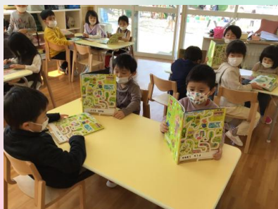
じっくり集中😌たどたどしくひらがなを読んでいる姿もまた可愛いのです❤️