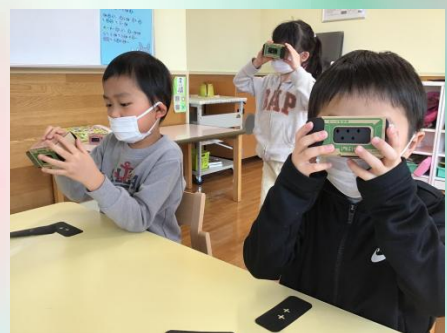
あら不思議✨虹色の綺麗な光が出現🌈