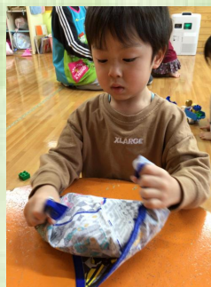
結ぶ端っこは離さないようにと しっかり握っています。