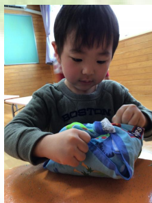
「よし、もうすこしだぞ！」最後まで気は抜けませんね。