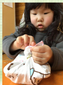
この表情と手つきと指使い。緊張感と頑張りが伝わってきます。