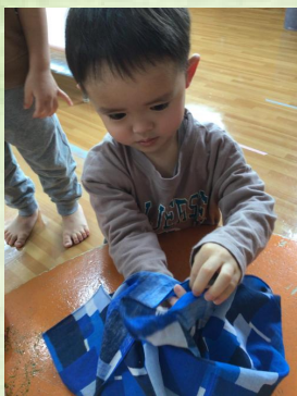
「端っこはこうやってトンネルにいれるんだよ」