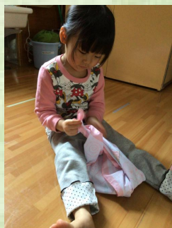
ダイナミックに全身を使って取り組んでいます 😊 わかる、わかる、その気持ち！