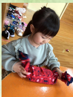
端っこをバツテンにして結ぶんだよね。「できるよ、せんせいみててね」「はい、ちゃんとみてますよ」 😊