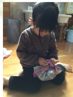
きれいな完成を目指して最後のチェック中。