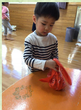
写真を撮る間も無く 😞、テキパキ進行中。