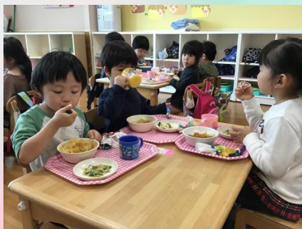
新しいグループでの給食です。