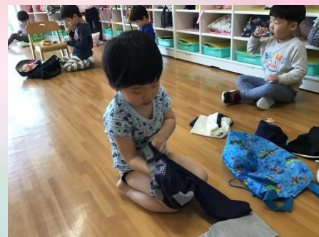
次はパジャマにお着がえ👖