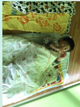
そして、おやすみなさ～い