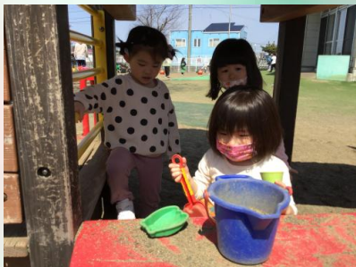
こちらは「からいアイス🍷屋さん」子どもは食べられないそうです(笑)