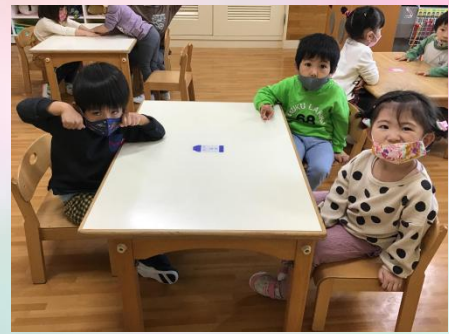
青色クレヨングループ。