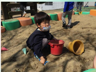
これからケーキ作ろうかなって思ってるんだ(*^- ^*)