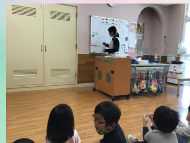
さて、今日はグループ決めをしました(*^-^*) 最近自分だけのクレヨンを手にして、クレヨンやその色に関心が高まっているので、今回はクレヨンの色をテーマにしました♥