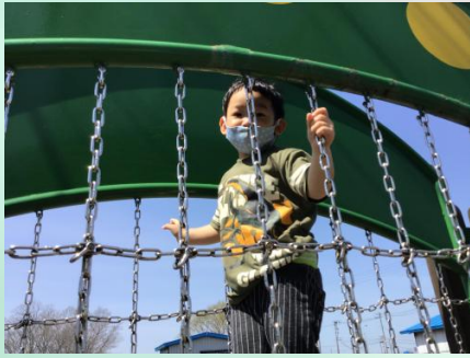
今日は天気がいい！！ということで、グループ決めの後は外遊び♪