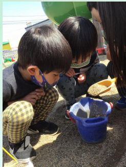
げんごろう、ってきりん組のお兄ちゃん達と言っ た。黒い虫だ～