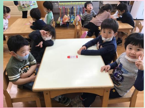
赤色クレヨングループ。