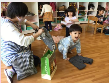
きれいに畳めるよ～！