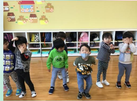
朝は元気に歌から！！