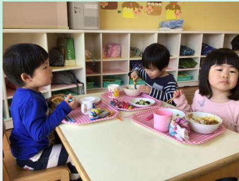
こちらはオレンジクレヨングループさん。