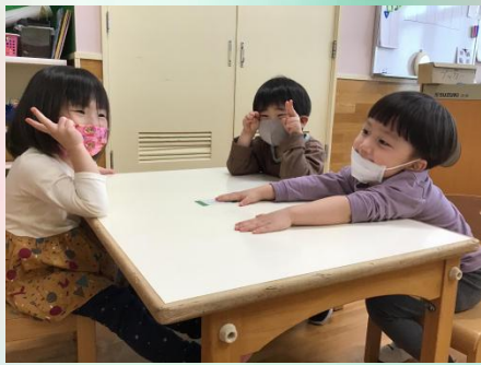
緑色クレヨングループ。