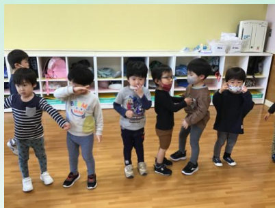
最近「パプリカ」のリクエストが多いので、パプリカで元気にスタート！