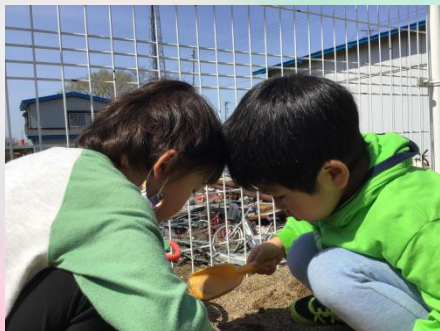
こちらはアリの観察中。