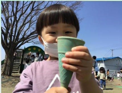
これは青森でとれたいちごの、いちごアイスです 🍓