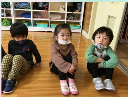
ぼくでしょ♪ 私よね♪