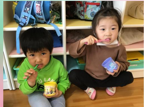
食べたら磨く、約束げんまん。ぴっぽっぴ♪