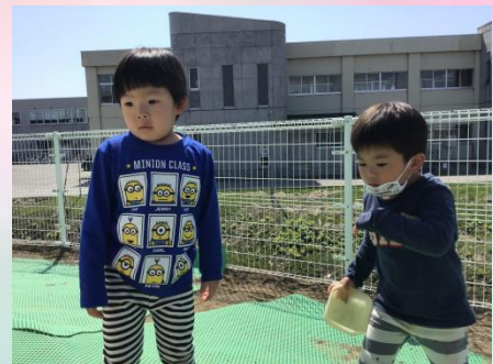
今、そこにさ、クモいた！