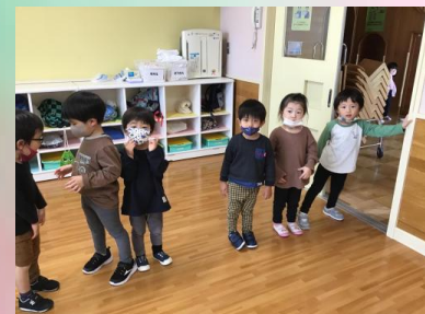
あとは「ちゅーっりっぷ」「てをたたきましょう」「しあわせなら手をたたこう」「ドラえもん」「おはようクレヨン」などなど歌っています(*^-^*)