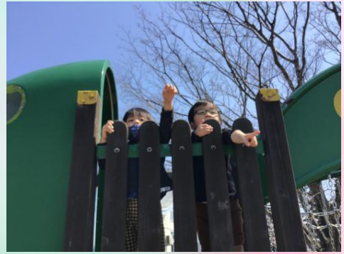
先生！あっちに「かもさん」いるよ！