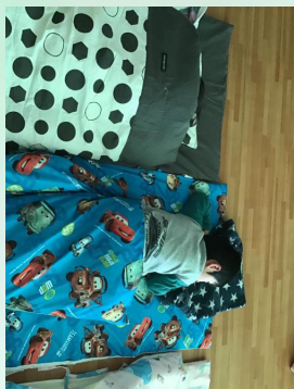
いっぱい遊んだら疲れたね。