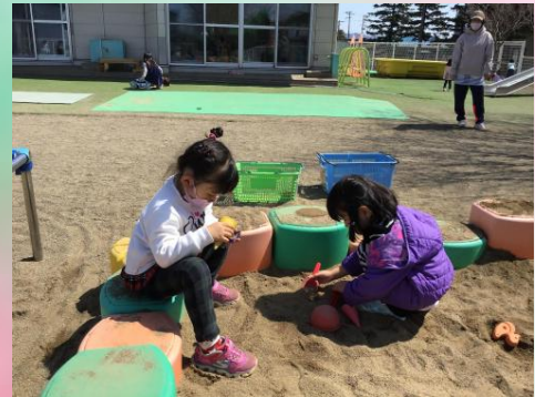
きりん組のお姉ちゃんと砂遊び♪