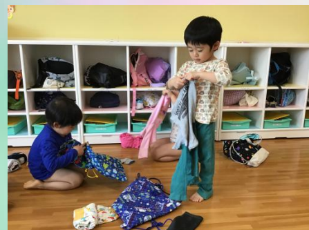
僕も上手にお着がえできるよ！