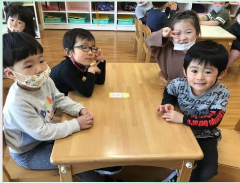
こちらは黄色クレヨングループ。

そして、くじ引きをして、自分の色が決定！この色がいい！とごねる子がいるかな…と思いましたが、そんなことなく、自分の色を喜んでいました(*^-^*)