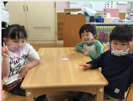
ピンククレヨングループ。