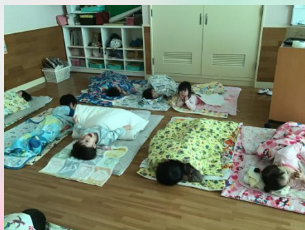
午後のおやつは何かな～？

朝は涙の登園の子も、来てしまうと、今日は何をするの？とその日の活動がとても楽しみな様子。今日はグループ決めです。「グループ」の意味を理解しやすいようにクレヨンのお家に自分達の名前を入れていきました。くじ引きも新鮮だったのか自分の好きな色にこだわりすぎることなく、すんなり自分の引いた色を受け入れてニコニコ♪これからこのグループをいかしながら友達と一緒に楽しめる活動を増やしたいと思います。