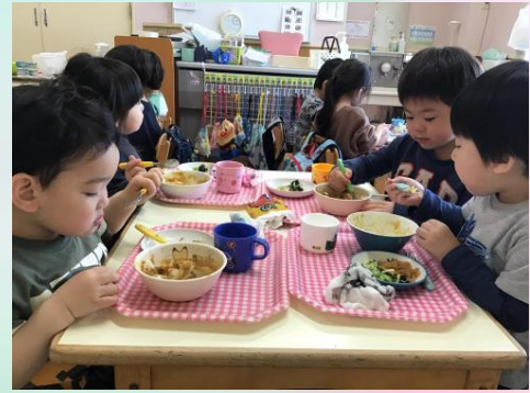
このサラダもおいしいよ♪