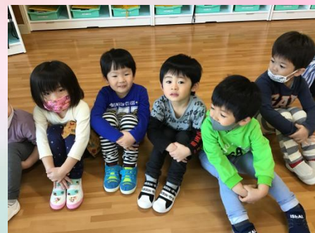
誰が一番かっこいい？