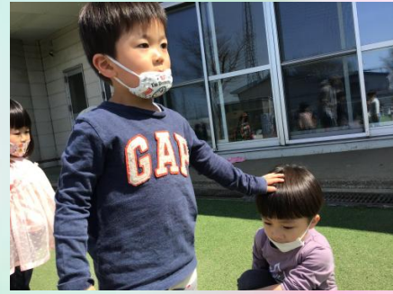
転んじゃってすりむいちゃったんだったって。「大 丈夫だよ、よしよし」