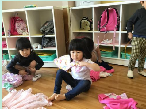
私も上手なの～。ちゃんと写真に写してね！