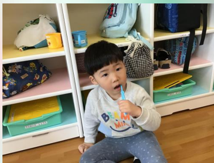
奥歯を磨いてます☆