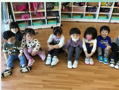
歌い終わると、かっこよくお座りです♥ うさぎ組になって覚えた「三角座り」です。