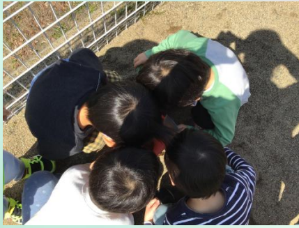
頭がいっぱい(笑)カメラが入る隙間もなく、虫を見 ています(*^-^*)