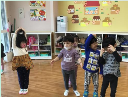
朝のお始まりがはっじまっるよ〜♪「トントン、ぴ！トントン、ぴ！」とビーマーチに合わせて並びます♪