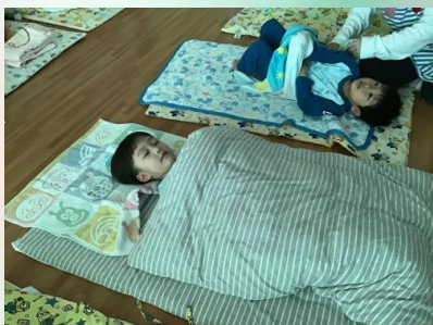
眠る前に読んでもらったオオカミのお話が頭から離れず、ずっとオオカミの話をしています(笑)