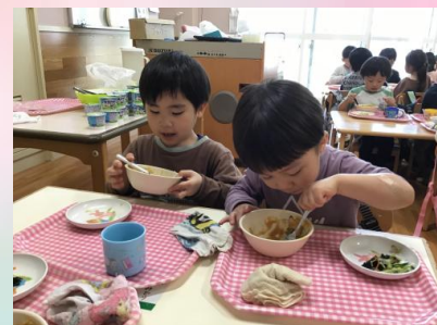
いっぱい遊んだらお腹がすいたね！今日はカレー ライス🍴