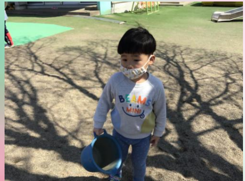
バケツもって何を作るの？