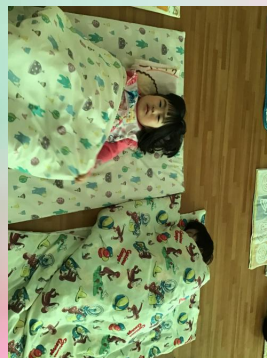
起きたらまた、いっぱい遊ぼうね！