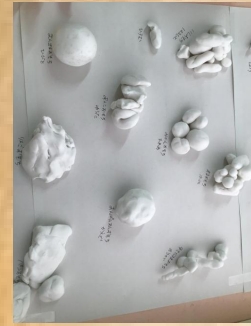
写真で見にくいかもしれませんが、ご了承下さい（；Д；）